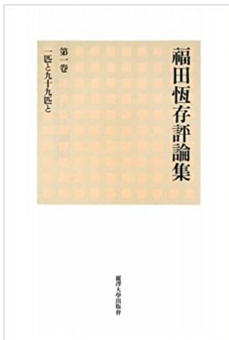
『福田恆存評論集〈第1巻〉一匹と九十九匹と』