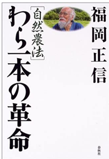
『自然農法 わら一本の革命』福岡 正信著、2004年。