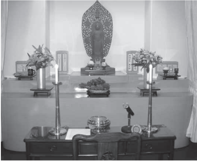
写真2 ダーマセンターの宝前

ティにある。オクラホマ州は、バイブルベルトといわれる聖書主義キリスト教と福音派プロテスタントの信仰が広まっているキリスト教篤信地帯に位置し、プロテスタント、なかでも南部バプテスト、メソジストが多く、政治的には保守的なキリスト教の地帯である。