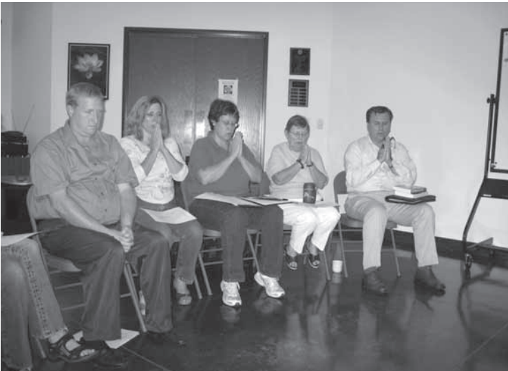
写真13 サンデーサービスの法座で題目三唱するメンバー