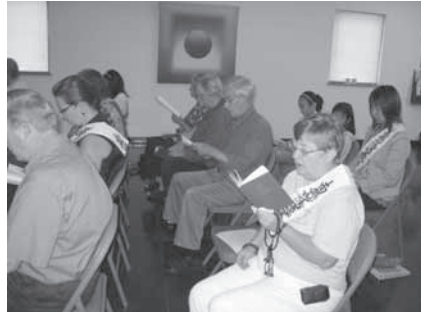
写真5 サンデーサービスでの読経供養