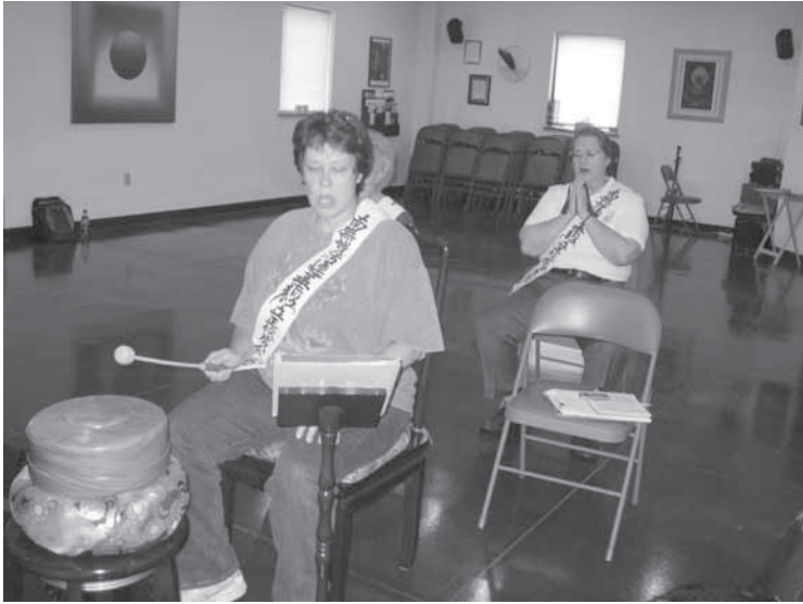
写真8 儀式のトレーニング・木鉦の練習