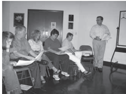
写真7 サンデーサービスでの 本尊拝受予定者のダーマトーク