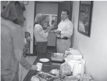
写真6 サンデーサービスでの コーヒーブレイク