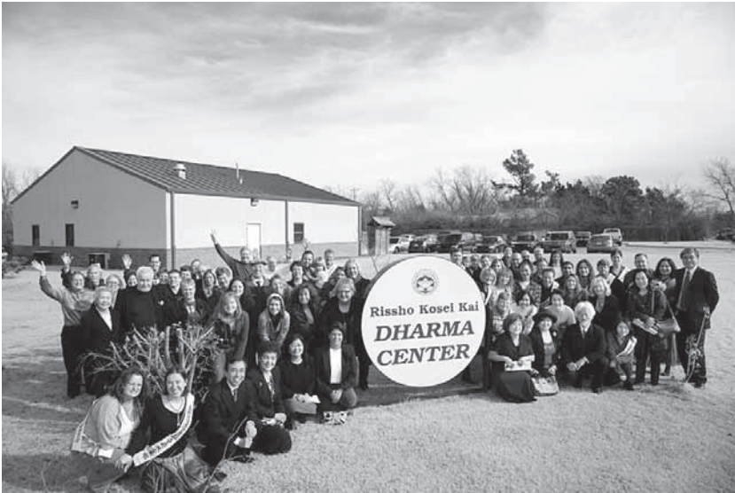
写真1 ダーマセンター（立正佼成会オクラホマ教会提供）

International of North America) がカリフォルニア州アーバイン市にある。アメリカにおける佼成会の会員の多くは日本人・日系人であるが、その中で現地アメリカ人（非日系人）の布教が進展しているところがある。オクラホマ教会（オクラホマ州）とロサンゼルス教会サンアントニオ支部（テキサス州）である。なかでもオクラホマ教会は、2007年12月にロサンゼルス教会のオクラホマ支部から教会に昇格したもので、2009年12月に、初めて非日系アメリカ人の教会長が誕生した。本稿では、オクラホマ教会の事例をとりあげる。