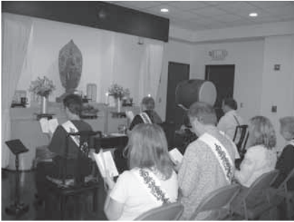
写真4 サンデーサービスでの読経供養 (アメリカ人メンバーの導師・協導師)