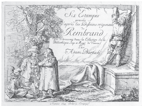
図5 アダム・バルチュ《レンブラント素描ファクシミリの表紙》エッチング、1782年