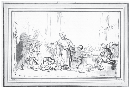
図6 アダム・バルチュ《相応しくない婚礼客の諭》(レンブラントに基づく)エッチング、ドライポイント、アクアチント、1782年

て五二一点あり、それに加えて帰属作品がある。バルチュは素描や版画の複製版画を制作したが、とりわけ素描の複製版画において、その調子やタッチにいたるまでをさまざまな技法を駆使して見事に再現している。まず挙げるべきはレンブラントである。バルチュは一三点のレンブラント素描をしており、そもそも一七八二年に六点のレンブラント素描のファクシミリ 52 を出版したが、彼の複製版画制作で大きな意味を