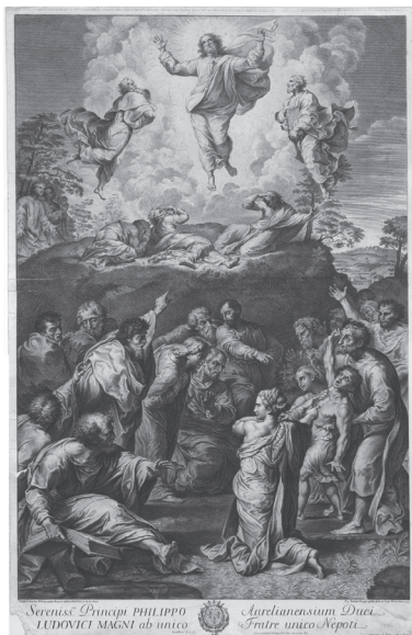
図3 ニコラ・ドリニー《キリストの変容》(ラファエロに基づく)エッチング、1705年