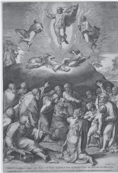
図2 コルネリス・コルト《キリストの変容》(ラファエロに基づく)エングレーヴィング、1573年

らであれ別の画家の作品からであれ、版画家の創意が込められてさえいれば、オリジナル版画と呼んでいる。そこに複製版画を区別する意識はない。バルチュが挙げているラファエロの《変容》の複製版画では、いずれもラファエロが原画という記載はもちろんされているが、コルネリス・コルトの作品には制作したとしかなく(図2) 43 、シモン・トマサン、ニコラ・ドリニーの場合には下絵を描き、彫版したと明記され(図3)、一方ラファエロ・モルゲンの作品は、彫版した版画家と下絵を描いたステファノ・トファネッリの名が記されている(図4)。実はモルゲンはこの前にも同作品の版画化を試みたが、模写をしたジョヴァンニ・バッティスタ・テッレラの下絵を不服とし