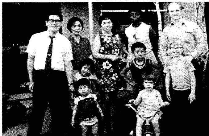
「1974年頃、大泉学園の自宅にて」

る。けれども、ここに連なる人々が重ねてきた毎日の業を覚え、思い直す。知恵を出し合い、問題に向き合い、女性たちの生活を支えるために、与えられたものを分け合う。必要な支援を必要な人に届ける。生活を少しでも前に進めようと実際に力を発揮しているのは、ここに集まる多様な背景をもつ女性たち自身なのである。このようにして、「いずみ寮」が支援してきた女性は、半世紀のうちに延べ1万人を超えている。