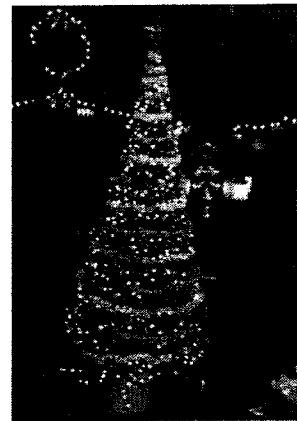
上海市にある国際礼拝堂でクリスマスの時期に撮影