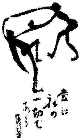
賀川豊彦 画 「愛は私の一切である」