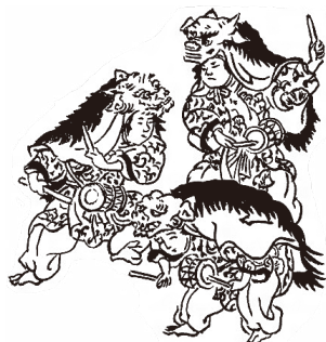
図1：長谷川光信画 角兵衛獅子 『絵本御伽品鏡 3巻』 (1739, 国立国会図書館所蔵)

獅子頭をかぶり、鶏の尾をつけた衣服を着た子供が二、三人、笛、太鼓の音につれて踊り回り、逆立ちなどの技を見せるもの。多く正月などに舞い歩き、災いを除くとい